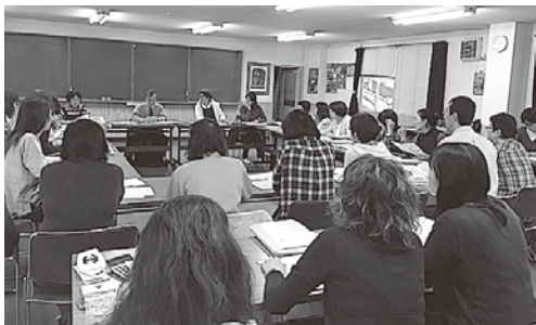
タイムリーなテーマに多数の参加がありました