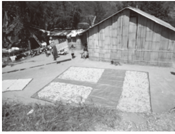
収穫したコーヒーの実を天日干し

るだけ早くお届けすることを心 がけ、そして産地への理解とコー ヒー利用の普及がコーヒー生産 者の自立支援につながるよう、組 合員に産地の様子を伝えること にも取り組んでいます。 コーヒー産地と直接つなが るまめ福のコーヒーで、ほっとひ と息ついてみては…?